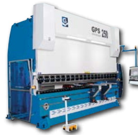
PLEGADORAS CNC con COMPENSACIÓN HIDRÁULICA AUTOMÁTICA