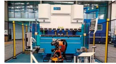
CÉLULAS ROBOTIZADAS de PLEGADO