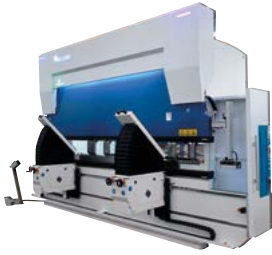
PLEGADORA CNC con MESA de COMPENSACIÓN MOTORIZADA