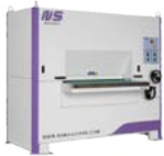
SACAREBABAS en CHAPA