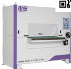
PULIDORA modelo DM1100C