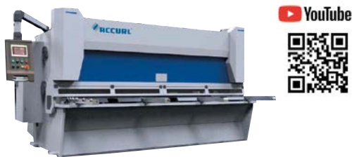
CIZALLA CORTE VERTICAL