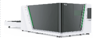
LÁSER con CAMBIO de MESAS