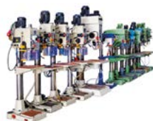
TALADROS de COLUMNA