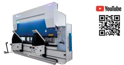
PLEGADORA CNC de 3, 4, 6 y 8 EJES