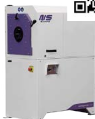
PULIDORA modelo OD120