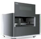
MESAS de PEQUEÑO FORMATO