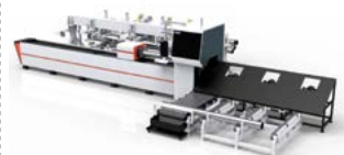
LÁSER de TUBO