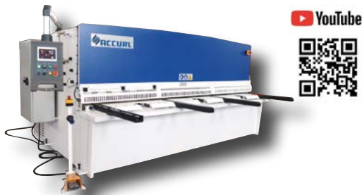
CIZALLA CORTE PENDULAR