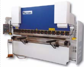
PLEGADORAS CONVENCIONALES con MESA de COMPENSACIÓN MANUAL