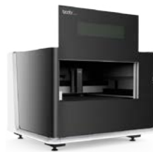
MESAS de PEQUEÑO FORMATO